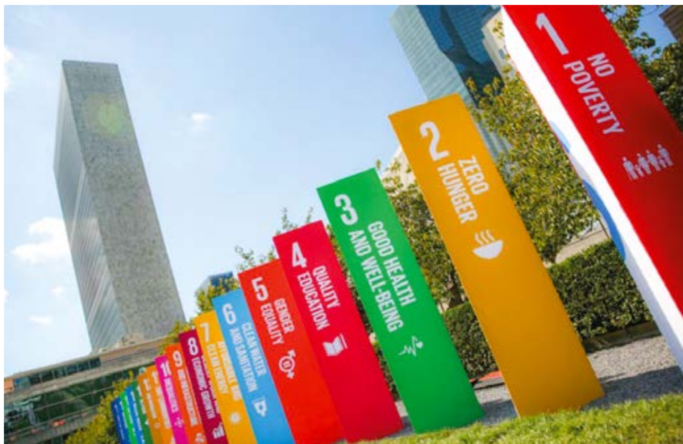
Gráfico 1. Fotografía Ilustrativa ONU.

de Alto Nivel sobre el Desarrollo Sostenible de las Naciones Unidas. El objetivo principal de este informe es fomentar el diálogo y el intercambio de experiencias entre los diferentes actores involucrados en la implementación de los ODS, y promover la colaboración, además del trabajo conjunto para lograr un desarrollo sostenible a nivel local con repercusión global. (Ciambra, 2020).