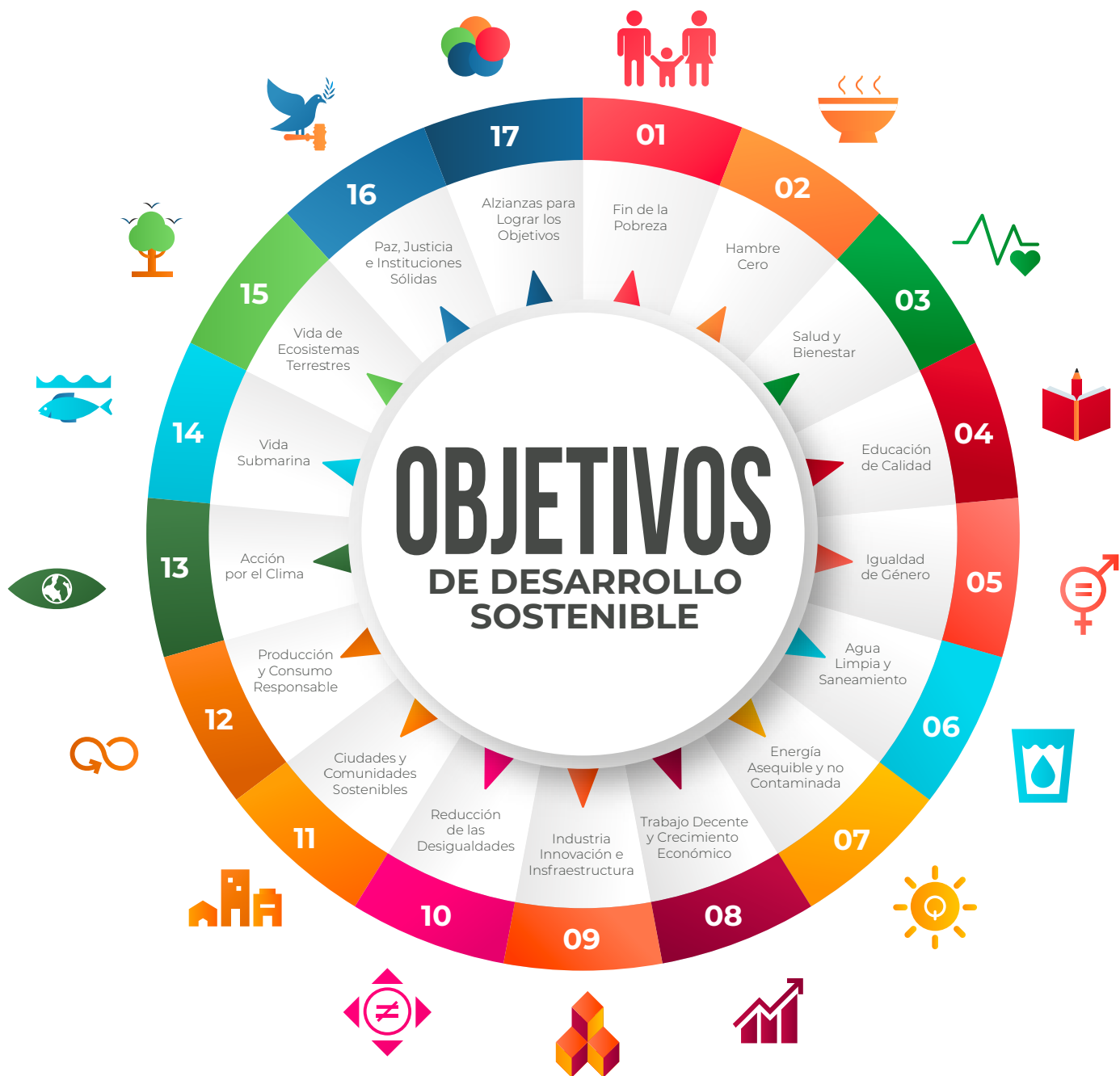
Gráfico 3. Portada Visor de Resultados Elaborado por: Alexander Moreira