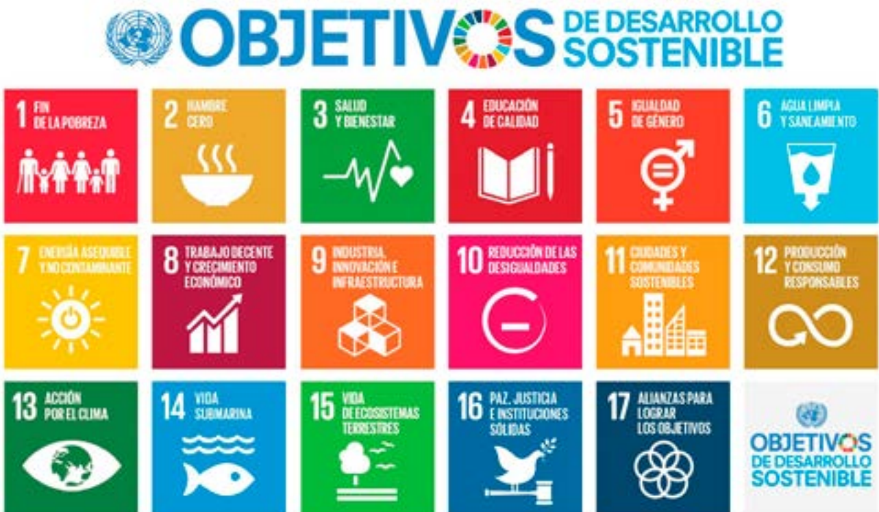
Gráfico 2. Objetivos de Desarrollo Sostenible